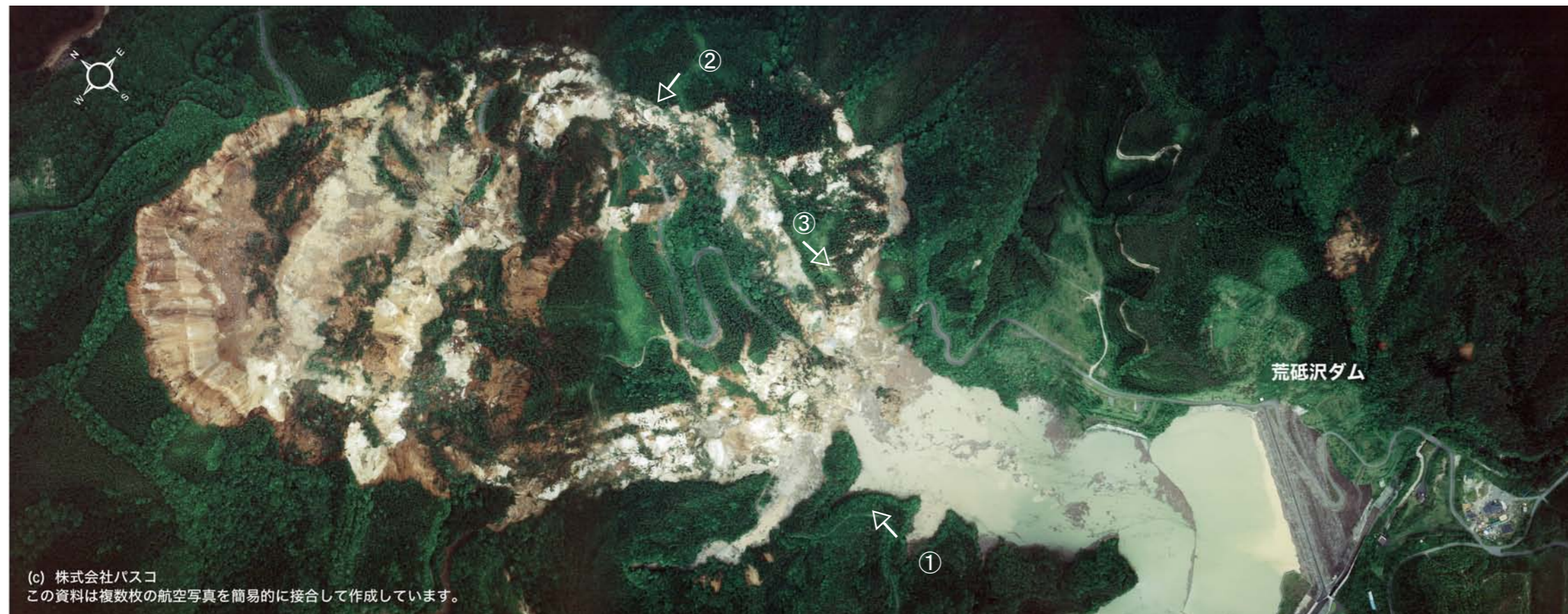
■ 宮城県栗原市 荒砥沢ダム上流付近 ■ 空中写真撮影日：2008年6月14日 ■ 撮影縮尺 1/8,000