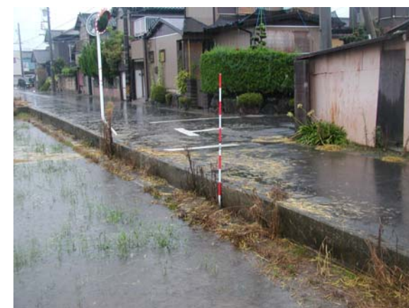
① 鹿乗川が増水し市街地に浸水した