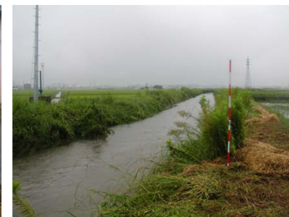
② 鹿乗川が増水し、水田が冠水した