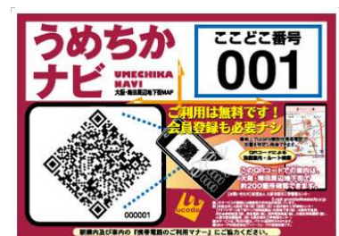
(図1)「うめちかシール」

「うめちかナビ」の機能として、地下街にある店舗やトイレなどの施設検索や位置確認、目的地までのルート検索、交通機関(鉄道・バス)の乗換ルート検索が主な機能となっています。また、地下街内で迷った人が、携帯電話を使って所在地(自分の位置)を特定できる機能も持っています。地下街内での位置特定は、地上での GPS の代わりに地下街内の各所に「うめちかシール(図1)」を設置し、そこに表示している QR コードを読み取ったり、「ここどこ番号」を入力することで現在地を特定できるようになっています。こうした工夫により地上だけでなく