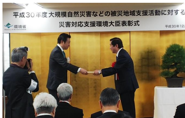
あきもと環境副大臣(左)から表彰状を受領する当社社長(右)