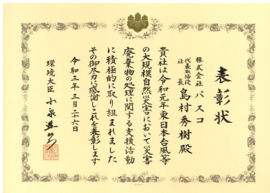
令和元年度 東日本台風等の支援活動で受領した賞状

本表彰は、令和元年と令和2年の大規模自然災害において支援活動を行った団体等に対し、その活動をたたえるもので、パスコは令和元年の台風災害、令和2年の7月豪雨災害における廃棄物処理に関する貢献として表彰されました。