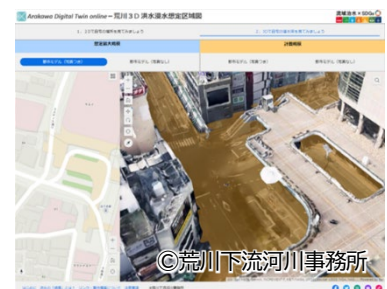
荒川3D洪水浸水想定区域図（下流域）

これにより、年間約300件ある問合せに迅速かつ的確に対応できるようになり、また、これまで部署ごとに管理していた各種台帳などのデータを3次元の河川管内図上に統合することで、業務効率化を実現しました。